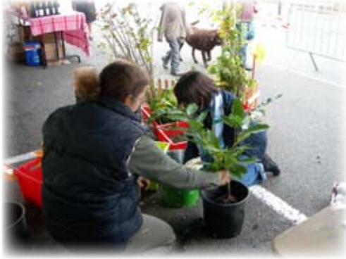
Atelier de plantation d'arbres.