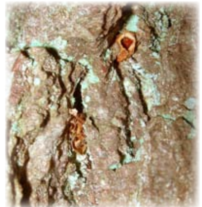
3. Graines mangées par un oiseau