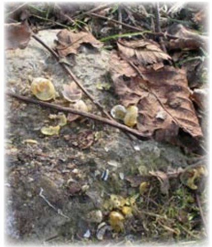
1. Enclume de la grive musicienne

5. Lorsque l'on trouve un tas de plume sur le sol, un oiseau a été attrapé et mangé par un prédateur; observer la façon dont les plumes sont arrachées : si c'est net, il s'agit d'un renard, si c'est effiloché, c'est un oiseau de proie (buse ou autour par ex.)