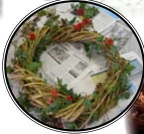
Joyeuses fêtes !