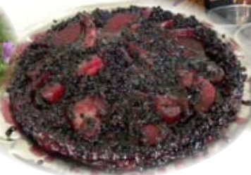
Tatin de sureau