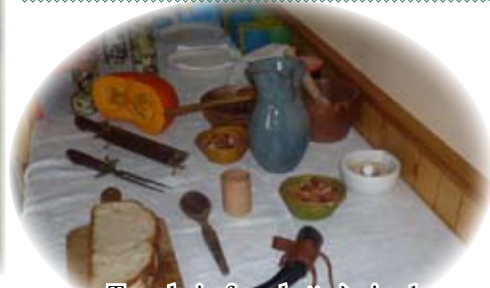
Tranchoir, fourchette à viande, cuillère et corne à boire...