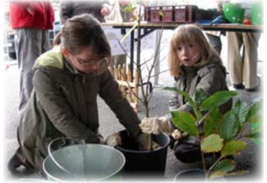
En équipe, c'est plus rigolo !