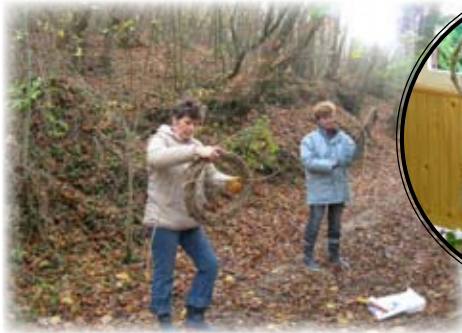
Ramassage et tressage des couronnes en forêt,