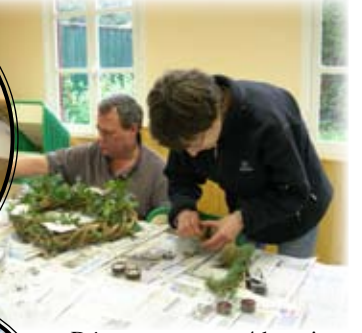
Décorer et mettre 4 bougies,