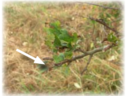
2. Abroutissement du chevreuil