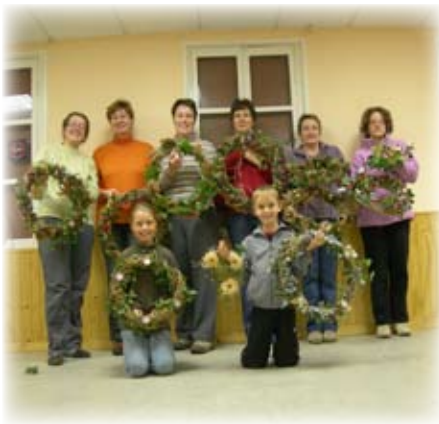
Et voilà le travail !