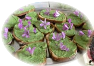
Tartines de mauve