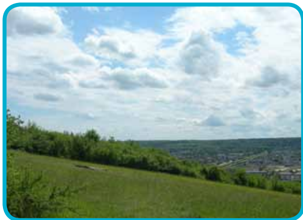
Vernon, vue de la Colline aux Oiseaux

Côté sud, les chemins traversant Bizy, Saint-Marcel, Saint-Just et Saint-Pierre d'Autils vous offrent de beaux paysages champêtres.