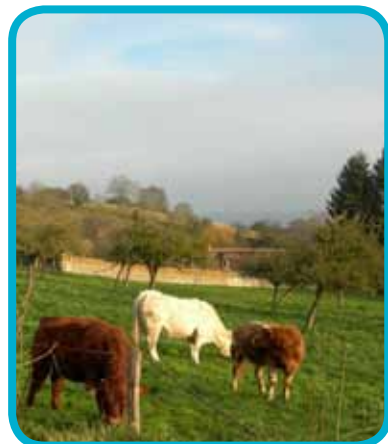
Saint-Pierre d'Autils, vu de St Just

► Prendre le départ du « Sentier des Jeunes pousses » à la salle des fêtes de la Chapelle Réanville (7,5 km) et pour profiter de la vue sur la vallée en passant par Villez-sous-Bailleul.