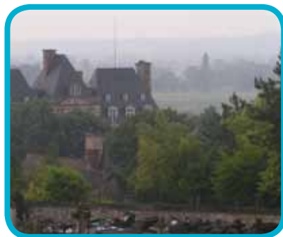
Château de Menilles, vue de la côte blanche

► Le circuit part des 3 étangs à Jouy-sur-Eure (12,5 km).